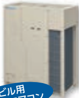
ビル用 マルチエアコン